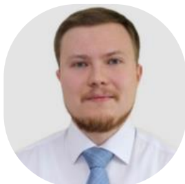
ЛЕВИН ЮРИЙ ЮРЬЕВИЧ Глава Представительства в Республике Казахстан