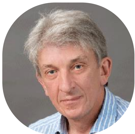
ШАНАУРИН ДМИТРИЙ ГЕННАДЬЕВИЧ Президент